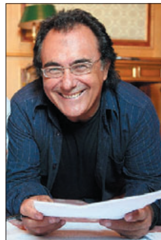
LE CANZONI Dolcenera presenta "Il mio amore unico", Al Bano "L'amore è sempre amore" e Sangiorgi ha scritto "Prova a dire il mio nome"