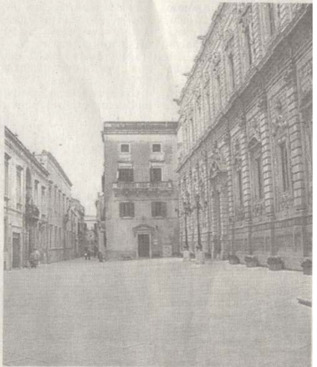
Palazzo dei Celestini sarà il set dell'evento

«Mi definisco un buon prosatore, ma un mediocre poeta. E' stata la politica ad allontanarmi un po' dalla letteratura, che